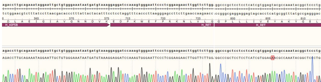
Fig 2. Sanger 测序结果